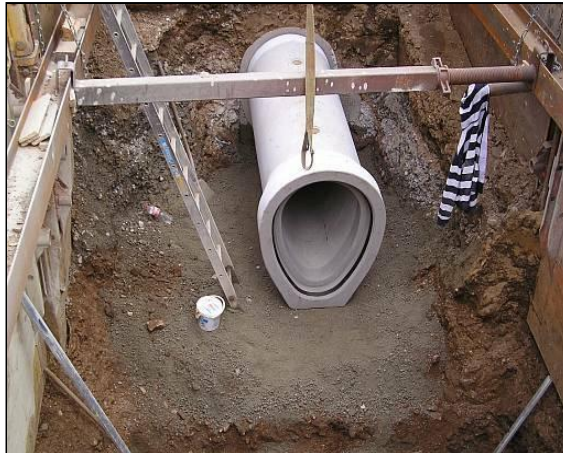
Einmessung auf der Baustelle